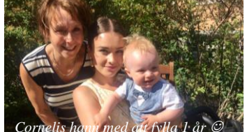
Cornelis hamn med att fylla 1 år ☺