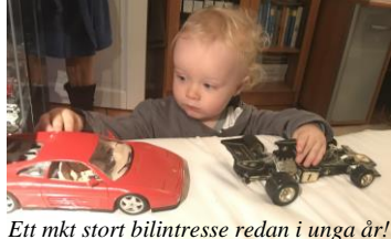
Ett mkt stort bilintresse redan i unga år!

Rebecka & Jonas fortsätter att överraska oss – en lördag i början av september då vi fick glädjen att vara barnvakt till Cornelis, kom plötsligt ett sms som förtäljde att de unga två hade gift sig... ☺