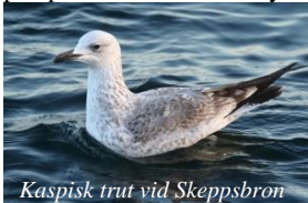
Kaspisk trut vid Skeppsbron

Tre nya livskryss år 2018 måste ur en 300-plussares perspektiv anses helt okey!