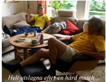
Helt utslagna efter en hård match...

Och det rullar på – tentorna klaras av på löpande band i inriktningen inför val av Master tycks vara mekatronik. Blir bra – då kan han hjälpa till med B20E-renovering!