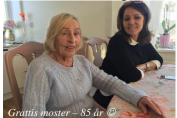
Grattis moster – 85 år ☺