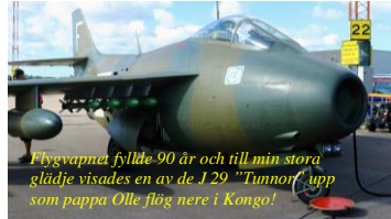
Flygkapten fyllde 90 år och till min stora glädje visades en av de J 29 "Tunnan" upp som pappa Olle flög nere i Kongo!