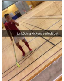
Linköping klickers serie debut

2016 blev ett katastrofår ur ett ornitologiskt perspektiv – endast en bronsbis blev noterad som ett nytt livsX.