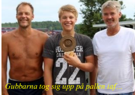
Gubbarna tog sig upp på pallen till!

Årets Grytökamp gick som vanligt i ungdomens favör: ointres.se/grytokampen.htm