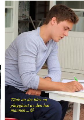
Tänk att det blev en plugghäst av den här mannen... ☺