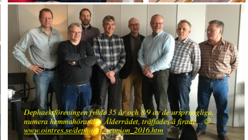
Dephaekföreningen fyllde 35 år och 89 av de ursprungliga, numera hemmahörande, Alderrådet, träffades å firade... ☺ www.ointres.se/depheac/union_2016.htm