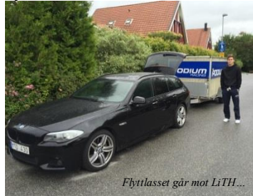
Flyttlasset går mot LITH...