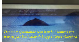
Det mest spännande som hände i somras var när ett par kushakar dök upp i Gryts skärgård!