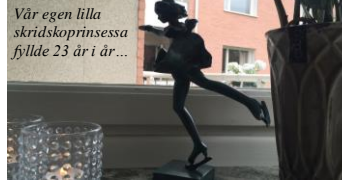
Vår egen lilla skridsko-prinsessa fyllde 23 år i år...