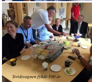
Stridsvagnen fyllde 100 år