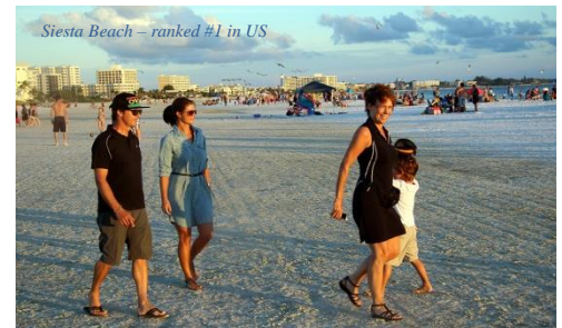
Siesta Beach – ranked #1 in US