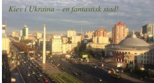
Kiev i Ukraina – en fantastisk stad!

Ska ni besöka Kinesiska muren rekommenderas en tidig morron vid soluppgång innan andra besökare intagit byggnadsverket!