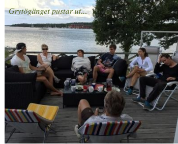
Grytögänget pustar ut...

Att få kolla F1 i Österrike en midsommarhelg funkade om familjen lurades med!