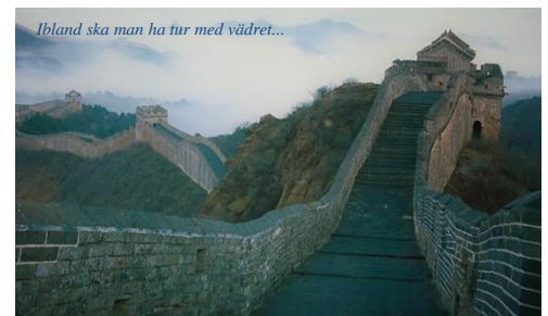
Ibland ska man ha tur med vädret...