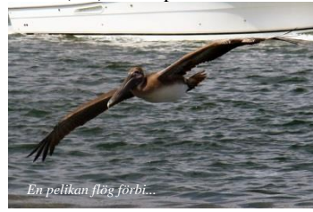
En pelikan flög förbi...

spetten på Gotland som kryssat under (löv)verket på 2:a försöket!